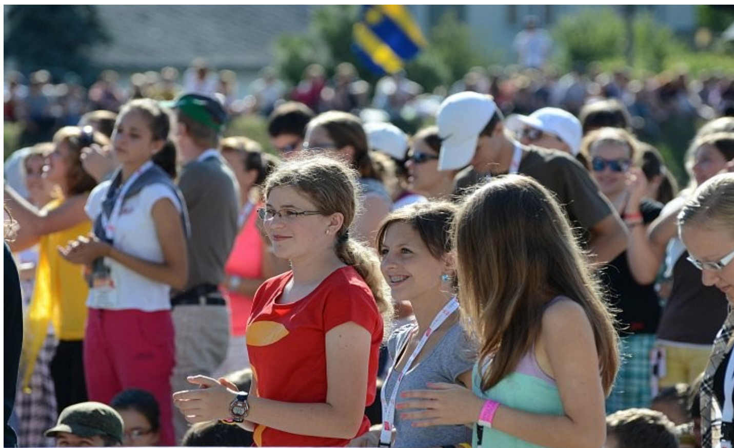
Ze setkání mládeže ve Žďáru nad Sázavou