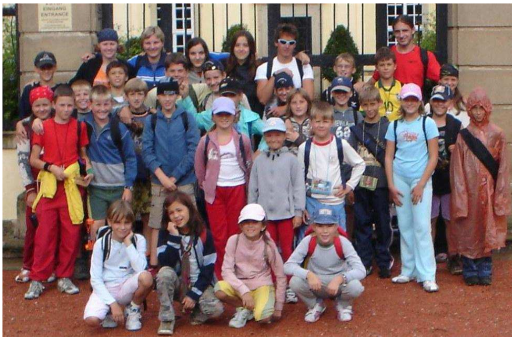
Účastníci tábora Malé Antiochie v Boršicích