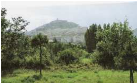
Cascia, kde žila sv. Rita

V Římě bylo r. 1904 založeno bratrstvo s Ritiným jménem. Také charitativní zařízení „Talleres de Santa Rita“ připomíná světicí – jde o dílny .